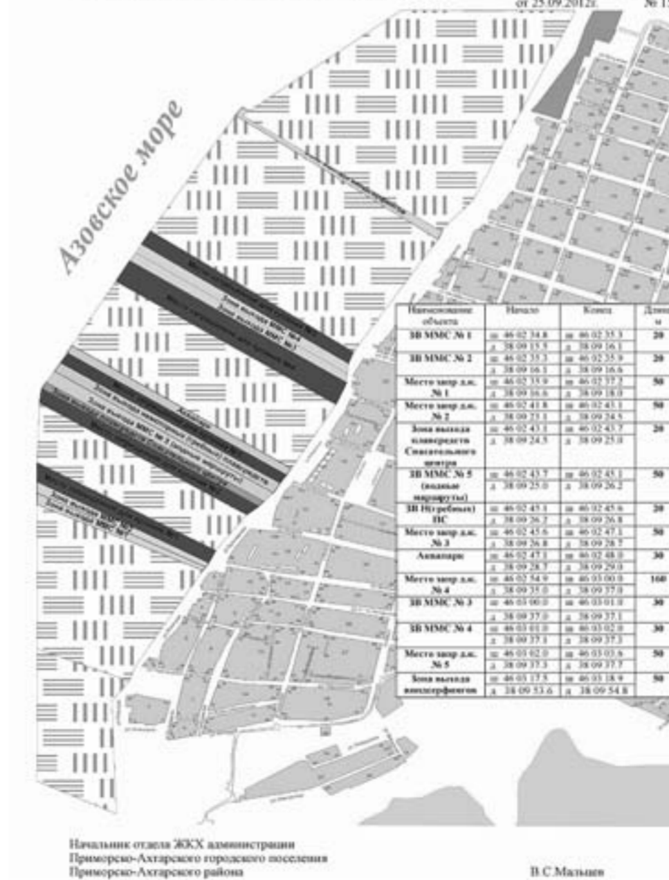
Приложение №5 УТВЕРЖДЕНЫ постановлением администрации Приморско-Ахтарского городского поселения Приморско-Ахтарского района от 25.09.2012г. № 1594